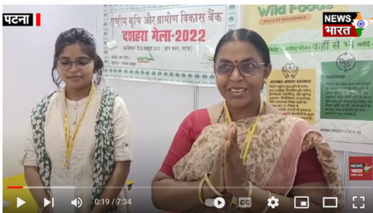
ज्ञान भवन में लगे महिला उद्योग मेले में मिल रहे तरह-तरह के आइटम, बड़ी संख्या में पहुंच रहे विजिटर्स.