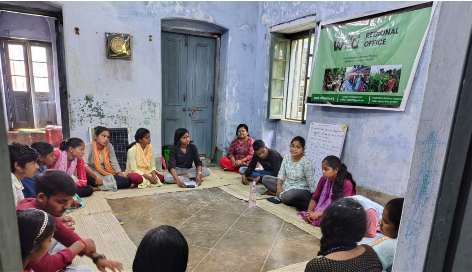
Leadership training of youth changemakers

“The youth is the future of the nation. Invest in them and you invest in the future”, Jawaharlal Nehru!